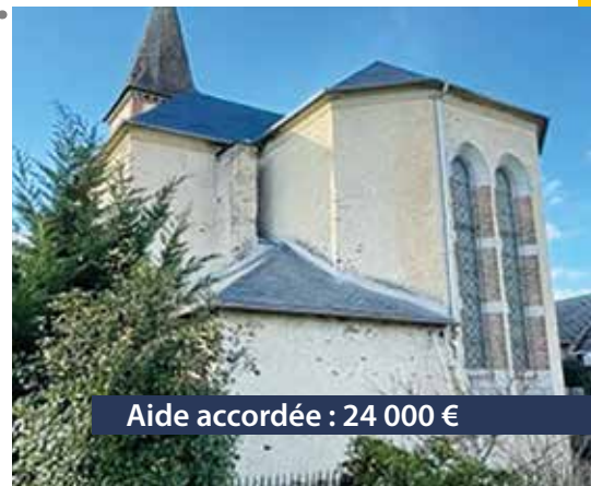
Aide accordée : 24 000 €