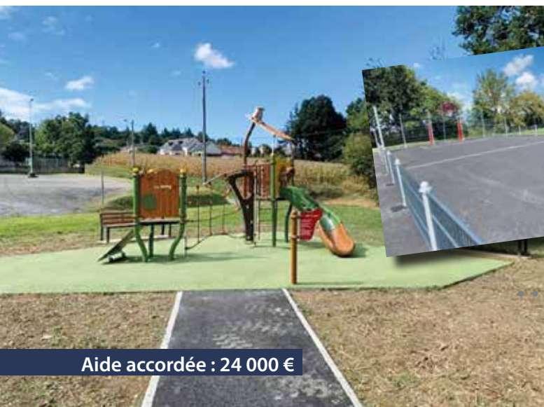
Aide accordée : 24 000 €