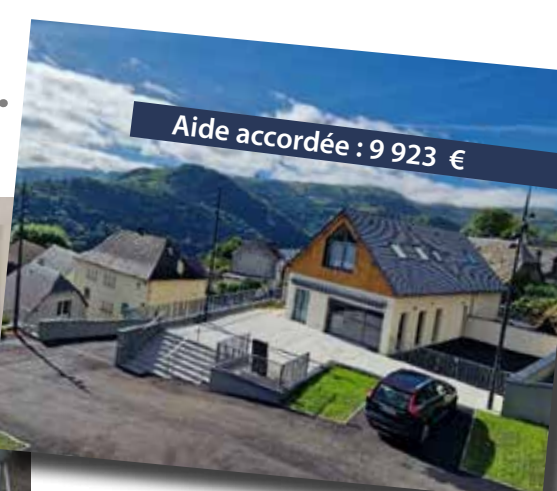
Aide accordée : 9 923 €

Enduits extérieurs et peinture de la grange réhabilitée en nouvelle mairie et logement