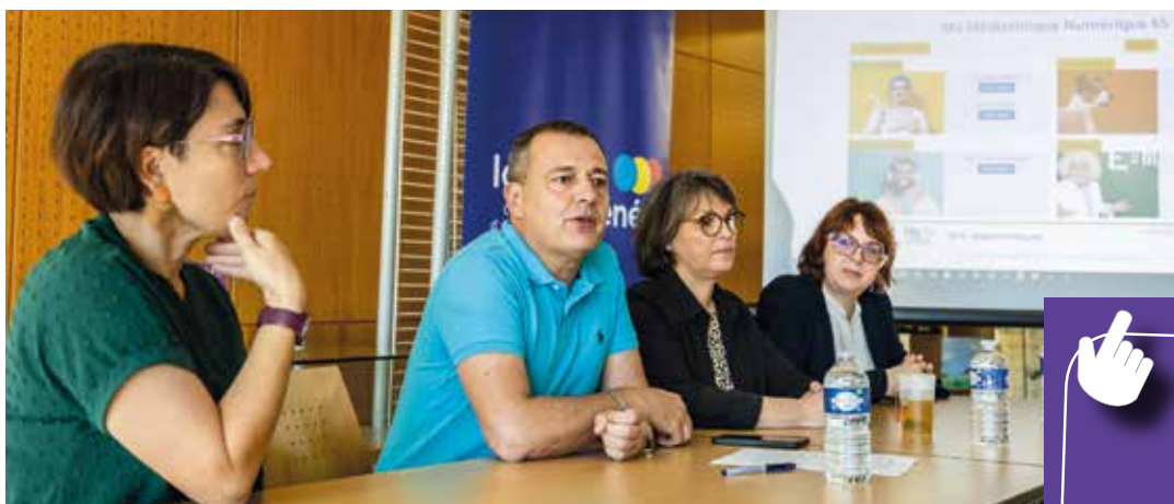
Lancement officiel de la plateforme le 5 juin 2024 à la Médiathèque de Vic-en-Bigorre

Les 10 bibliothèques, la ludothèque et le Bibliobus de votre agglomération vous proposent un abonnement gratuit et illimité ! Livres, BDs, mangas, revues, CDs, jeux de société, jeux vidéo... profitez de l'offre culturelle des établissements. Et pour rester connecté où que vous soyez, empruntez une liseuse numérique. Des centaines de références récentes sont disponibles.