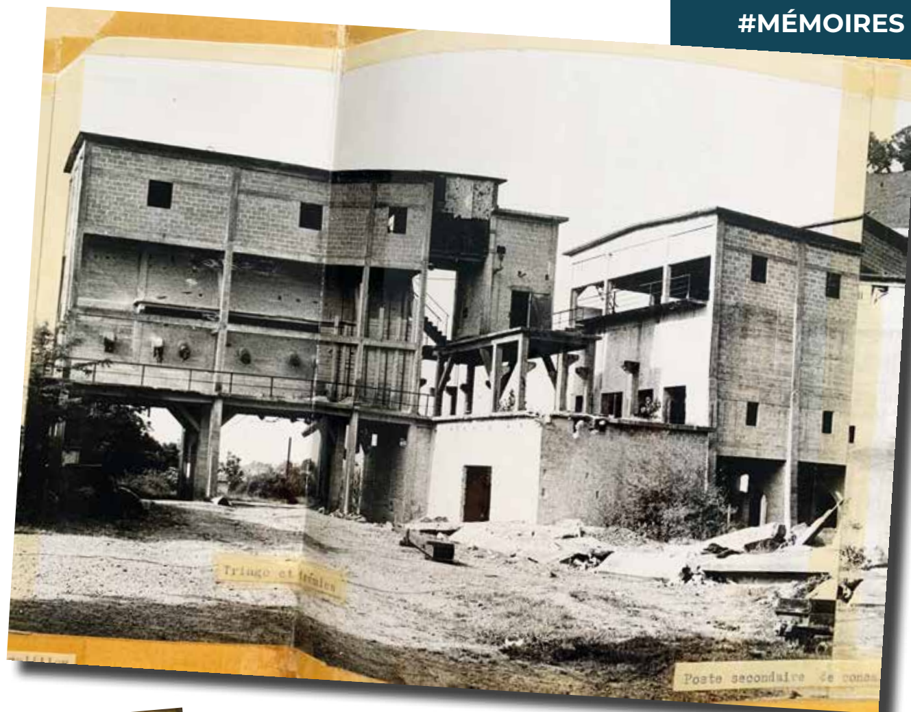
Bâtiments d'exploitation. Société de l'Ophite des Pyrénées