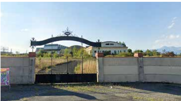
Capture image Google map.

Pour respecter le style architectural de certains bâtiments et grâce à des délais de fabrication plus court qu'en usine, MAB fabrique sur mesures ses menuiseries pour ainsi pouvoir proposer l'aménagement qui convient parmi un large choix de matières, de couleurs et d'accessoires.